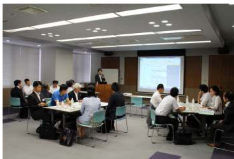
ワークショップ風景(イメージ)