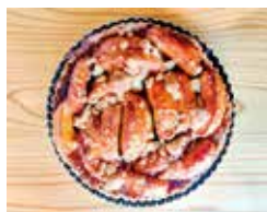
◀お店自慢のカフェラテと自家製の焼き菓子