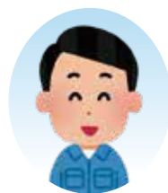
(※代表者写真や事務所写真等)