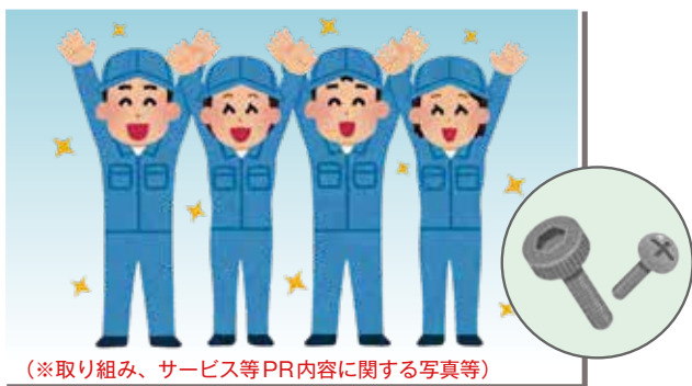
(※取り組み、サービス等PR内容に関する写真等)