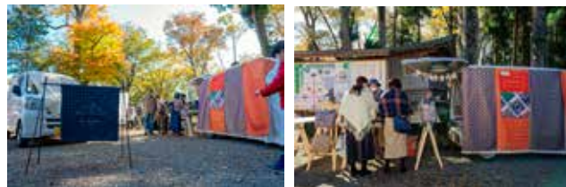
過去のマーケットの様子

B-TANマーケットは今回の「ハタフェス」が今年度初めての開催。「ハタフェス」のコンテンツのひとつとして、イベントを盛り上げる。